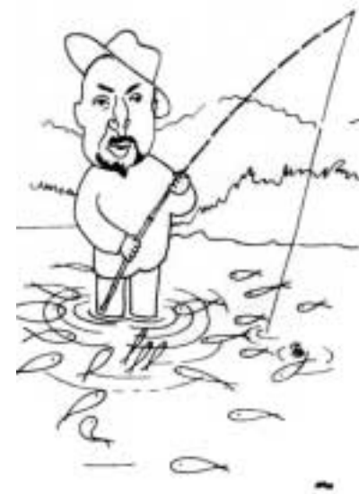
Mahen rybář – ilustrace Adolfa Hoffmeistra k článku F. Halase (Panorama, 8, 1931, s. 91)

Na to jakoby navazuje Mahenův vztah ke zřizovatelům a nadřízeným institucím. Vyznačoval se neohrožeností, s jakou kritizoval obce, politiky a veřejnost za nedostatečnou starost a péči o veřejné knihovny – instituce národní, tedy i jejich. V Listu, který nebyl ovšem nikam poslán. Čs. politikům (Tvorba, 1927, č. 1) Mahen morálně apeloval: „ Starejte se trochu více o nás (...). Je pravda, že se od převratu na poli lidové výchovy udělalo hojně práce, ale je pravda, že asi od roku 1923 trčíme a že nám na pomoc nejedete. “