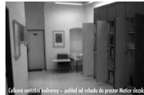
Celkové umístění knihovny – pohled od vchodu do prostor Matice slezské

Krátce jsem se zmínil o ČNB. Musím jí však věnovat větší pozornost, protože společně se Souborným katalogem periodik ČR či elektronickým katalogem KPB patří k hlavním nástrojům, které při popisu využívám. Všechny bibliografické záznamy knih, časopisů popř. dalších dokumentů vyhledávám v těchto databázích. Nalezené hity pak ve formátu ISBD stahuji do textového editoru a na lokální počítač, kde poté dochází k jejich úpravám, doplnění, popř. opravám. Jako nepostradatelný pomocník se také ukázal knihovnický portál The European Library, jehož prostřednictvím vstupuji na webové stránky národních bibliografií a souborných katalogů v Polsku, Německu nebo na Slovensku. I přes tyto moderní postupy mi však někdy nezbyvá, než se uchýlit k tradiční metodě de visu , především v případě úzce regionálních publikací a letáků, které v ČNB nenajdeme. Elektronické katalogy a ČNB mi v mnohém ulehčily práci, přesto by se našlo pár případů, kdy bych raději volil odlišný postup popisu a tvorby záhlaví. Proto některé zkopírované záznamy upravuji a zkracuji. Celý tento proces jsem pracovně nazval „poloautomatickou katalogizací“.