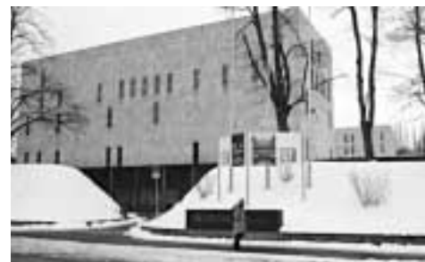
Knihovna v Drážďanech, budova se vstupem

Ke standardním doplňkům patří pracoviště s internetem a s elektronickými katalogy, všude je dostatek míst pro studium i pouhou relaxaci. Knihovna je vybavována technologií RFID, samoobslužných pultů využívá zatím kolem 30 % uživatelů. Zajímavostí je oddělení bestsellerů, kde jsou půjčovány nejžádanější tituly za po-