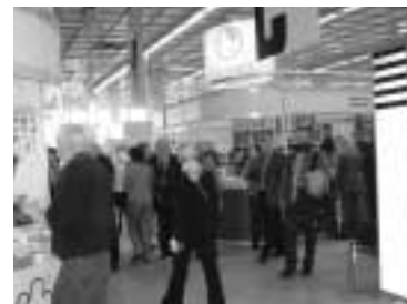
Knižní veletrh intelektuální literatury v Moskvě

Pokud si potřebujeme vytvořit ucelený obrázek knižní produkce v anglickém jazyce, a to především z britských (včetně těch menších), ale i severoamerických nakladatelství, stojí za to se vypravit na mezinárodní knižní veletrh v Londýně : http://www.lbf-virtual.com/ , který se také koná v březnu. Je to poměrně velký veletrh (v roce 2006 se zde očekává více než 1900 vystavovatelů) s tradicí od roku 1972. Mezinárodní obchodní charakter dostal ale až po roce 2000, kdy se stal evropským centrem prodeje autorských práv v oblasti angloamerické knižní produkce. Vedle literárních čtení, přednášek a seminářů lze na veletrhu absolvovat kurz tvůrčího psaní a být u vyhlášení vítěze soutěže