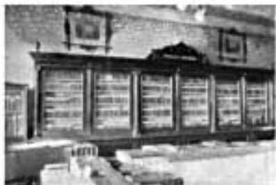
Dva historické pohledy z veřejné knihovny v Jaroměři

V té době překročil počet knih 30 000 svazků. V době okupace byla knihovna přestěhována do bývalých restauračních místností v tzv. Sladovně, dnes GE Capital Bank, kde s četnými obtížemi fungovala celé desetiletí. Teprve 19. prosince 1949 získala tehdy Okresní a městská knihovna budovu v areálu parku, kde sídlí dodnes. Původně obytná vila byla vnitřními úpravami přizpůsobena potřebám knihovny v sedmdesátých letech minulého století. Rozsáhlá rekonstrukce budovy proběhla v letech 2000–2001. Vnitřní přestavbou byly rozšířeny výpůjční prostory a na dosud nevyužité půdě byly vytvořeny pracovní knihovníci a sklady.