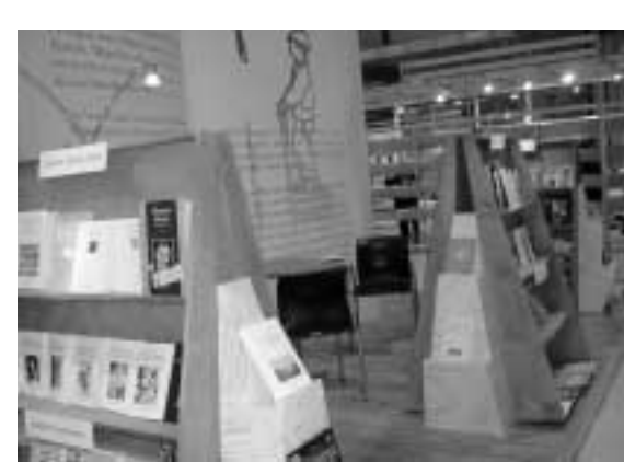
Z knižního veletrhu v Madridu

O něco přehlednější je knižní veletrh intelektuální literatury non-fiction , který se od roku 1999 koná na přelomu listopadu a prosince v Moskvě : http://www.expopark.ru/EN . Je to veletrh poměrně mladý a malý (rozsahem nikoli významem). V roce 2005 se zde představilo 200 vydavatelů z třinácti zemí. Tato akce je vyhrazena pouze pro solidní knižní produkci – jsou zde k vidění (a také ke koupi) vědecké a odborné publikace, slovníky, encyklopedie, ale i dobrá beletrie. Součástí veletrhu jsou obvykle literární čtení, autogramiády, výstavy, literární prémie a antikvární veletrh. Veletrh se těší velké návštěvnosti čtenářské obce mimo jiné také kvůli svému sídlu – příjemnému prostředí moskevského Ústředního domu umělců.