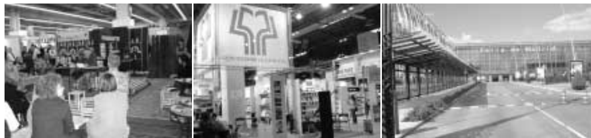
Autorské čtení na veletrhu ve Frankfurtu | Pohled na katalánský stánek a na veletržní areál na knižním veletrhu v Madridu

Největším, nejdůležitějším a vlastně nejstarším evropským veletrhem je Mezinárodní knižní veletrh ve Frankfurtu nad Mohanem (první zmínky o frankfurtském trhu pocházejí z roku 1150), který se koná každoročně vždy v říjnu ve veletržním areálu kousek od frankfurtského Hlavního nádraží. Má velkou tradici – knižní veletrh pak od roku 1949 – a každý rok přiláká tisíce vystavovatelů z více než sta zemí a stovky tisíc návštěvníků. V roce 2005 se zde prezentovalo přes 7200 vystavovatelů z 101 zemí světa. Veletrh má velmi přehledné webové stránky http://www.buchmesse.de , kde se mimo jiné můžete přihlásit jako odborný návštěvník a s předstihem si zakoupit permanentní