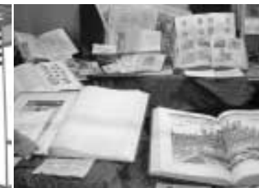
Pohlednice z knižního veletrhu ve Frankfurtu