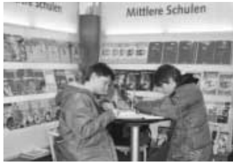
Lipský knižní veletrh, školáci