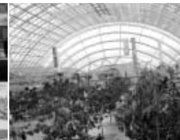
Veletržní areál v Lipsku

Mladý nakladatel roku. Na webových stránkách je dostupný interaktivní průvodce veletrhem, kromě angličtiny také v ruštině, španělštině, čínštině a arabštině.