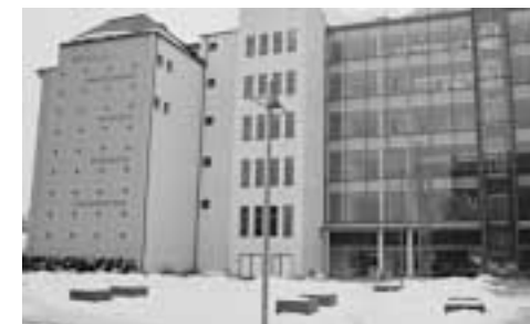
Městská knihovna v Chemnitzu, kulturní středisko DASTietz