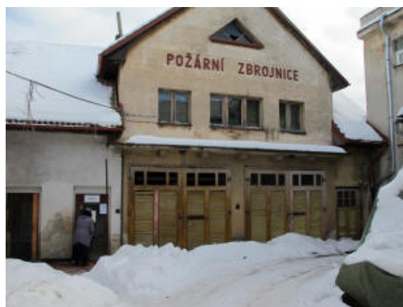
Obecní knihovna ve Stříbrné Skalici