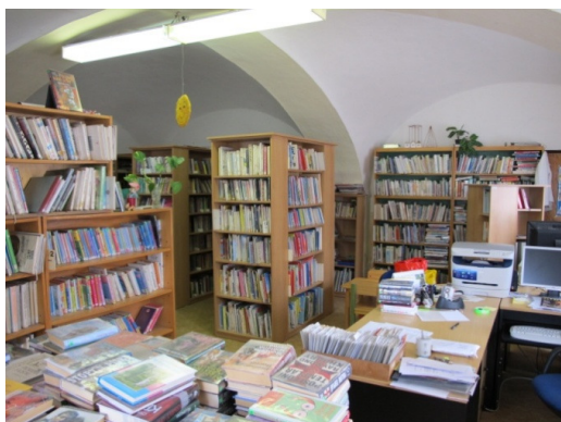
Interiér knihovny v Miličíně