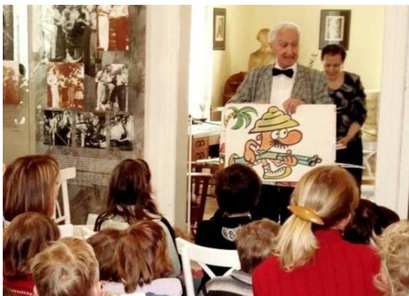
Městská knihovna Dobříš