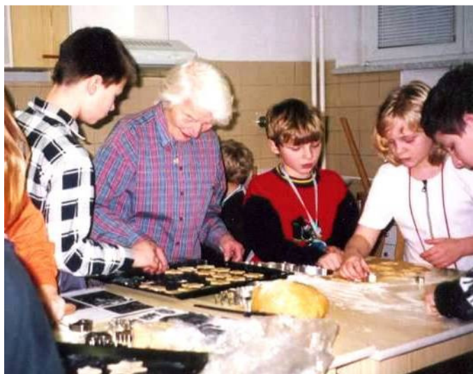
Městská knihovna Sedlčany