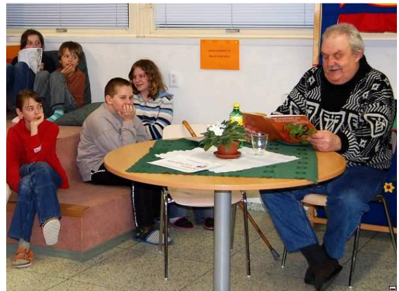
Městská knihovna Sedlčany