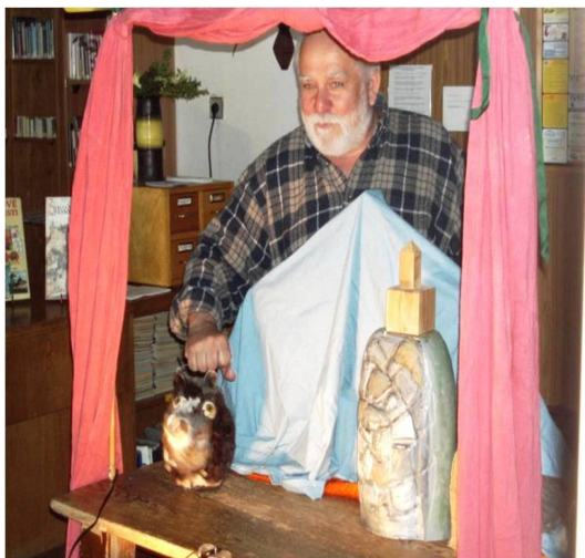
Městská knihovna Dobříš

Pokud zájemci ovládají třeba němčinu, mohou se podívat na švýcarskou stránku www.seniorweb.ch . Příkladem anglicky psaných stránek je kanadský web www.seniorsdaily.net/ .