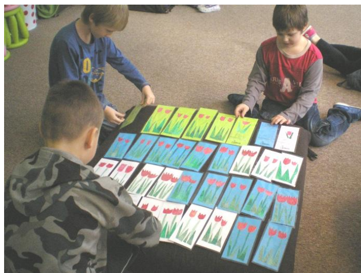
↓ záložky od dětí ze školní družiny při ZŠ Liptál na Valašsku

Děkujeme za Vaše příspěvky a těšíme se na nové zprávy od Vás!