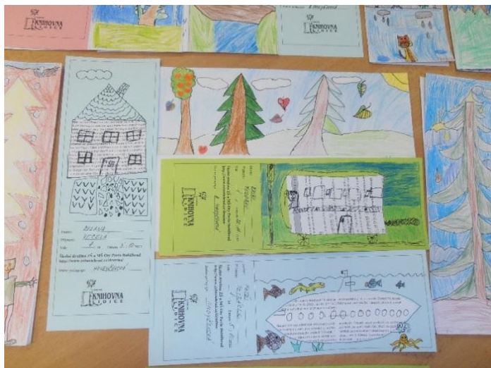
↑ záložky do knih od dětí ze školní družiny při ZŠ a MŠ Oty Pavla Buštěhrad