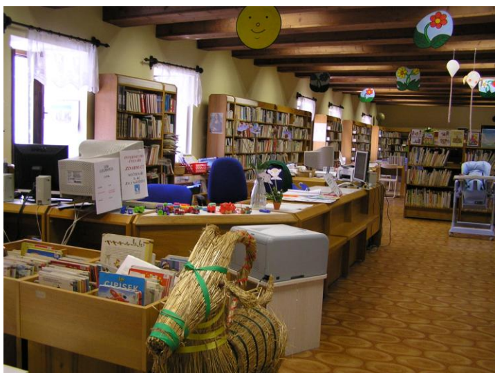
Interier Šmidingerovy knihovny Strakonice

Základem knihovny se stal soubor knih, které v roce 1843 věnoval městu Páter Josef Schmidinger. Také strakonická knihovna zažila stěhování. Roku 1888 byla umístěna v tzv. Besedě na Velkém náměstí, poté ve Spolkovém domě – Sokolovně, pak v obecné škole a v roce 1949 se usídlila v místě, kde je dodnes. Jako okresní knihovna slouží od roku 1950. V roce 2006 prošla knihovna spolu s celým areálem rekonstrukcí.