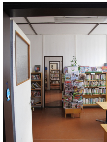
Interiér knihovny v Měšicích