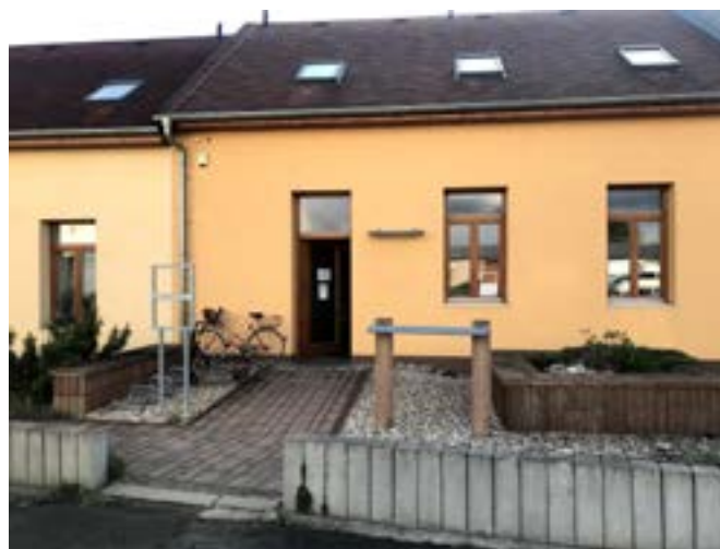
Foto návštěva v knihovně v Zeleneči

Obecní knihovna v Zeleneči byla během uzavření přestěhována do nových prostor. Nyní ji najdeme na adrese U Rybníka 13, Zeleneč.