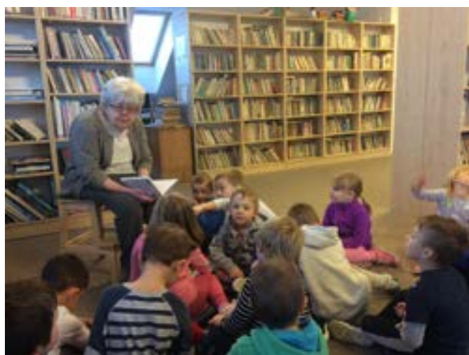
Foto: SVK v Kladně a Školní knihovna pro děti, mládež i dospělé ve Chrašticích

Zpracovala Svatomíra Fojtová, metodička KJD Příbram