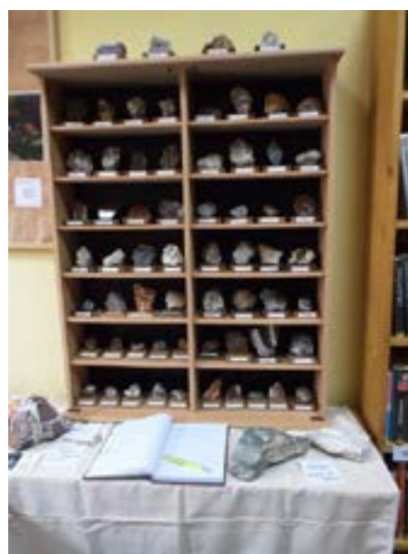
Foto: z výstav v Obecní knihovně Bzová