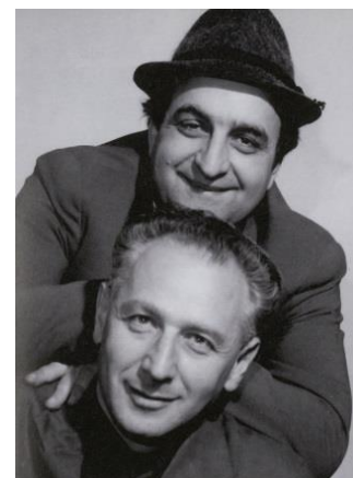
Ota Pavel se svým životním přítelem Arnoštem Lustigem

Středočeská vědecká knihovna v Kladně uspořádala ve středu 19. 6. 2019 slavnostní vernisáž výstavy Ota Pavel – známý i neznámý a ocenila vítěze v soutěži na téma povídek Oty Pavla.