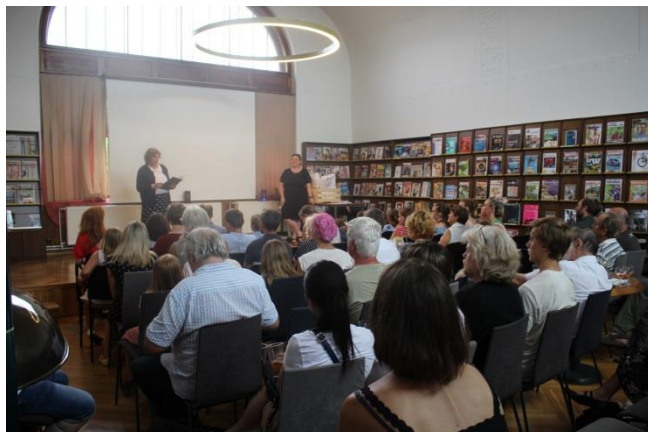
Sál plný návštěvníků

Výstava byla vytvořena v rámci projektu Židovští autoři Středočeského kraje ve spolupráci SVK v Kladně a spolku Buštěhrad sobě.